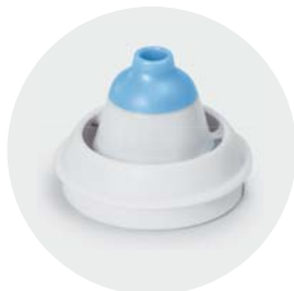
Adattatore nasale da 3 a 12 anni Nasal adapter from 3 to 12 years