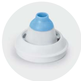
Adattatore nasale dai 12 anni in su Nasal adapter from 12 years old

— 50 — anni di eccellenza italiana years of italian excellence