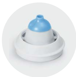
Adattatore nasale fino a 3 anni Nasal adapter up to 3 years